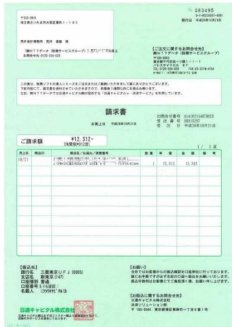
(2)仕入れ先の請求書