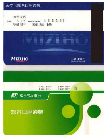
(3)銀行の通帳（コピーでも可）